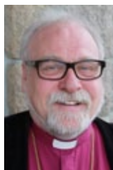
Biskop Atle Sommerfeldt, Borg Bispedømme Den norske kirke