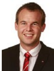
Kjell Ingolf Ropstad, Stortingspolitiker (KrF) og medlem av justiskomiteén